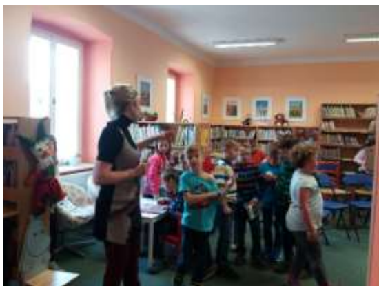
Děti jsou v knihovně často