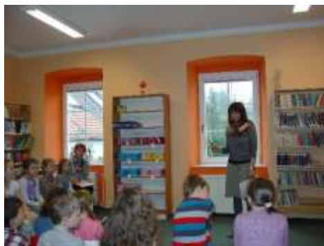
Děti ze ZŠ Budíškovice se v naší knihovně chystají k recitační soutěži