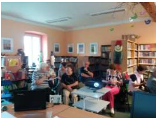
Začal další semestr virtuální univerzity třetího věku