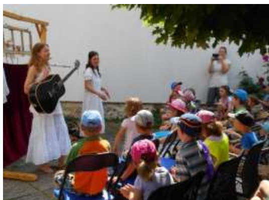
Celé Česko čte dětem