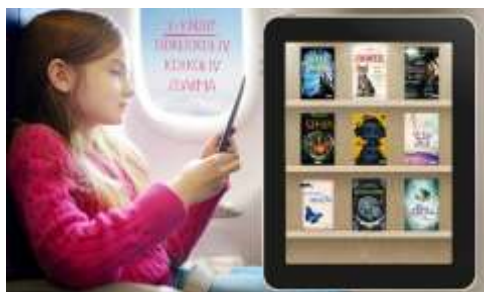
E - knihy