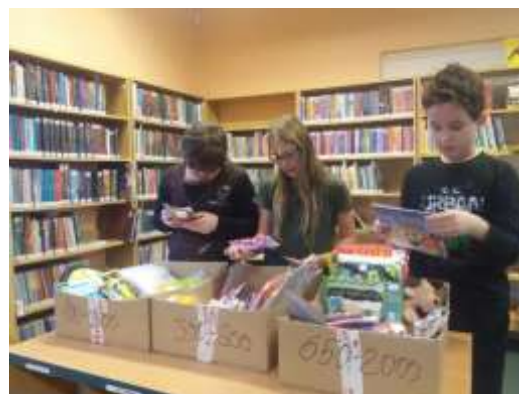
Krámek Lovců perel